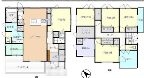
※現況と異なる場合は、現況優先とさせていただきます。