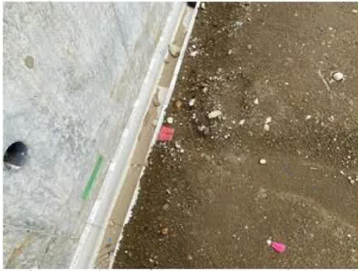
新しく造成工事を行ったお土地の為、境界標もしっかり設置されています。