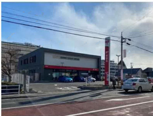
仙台南郵便局まで780m