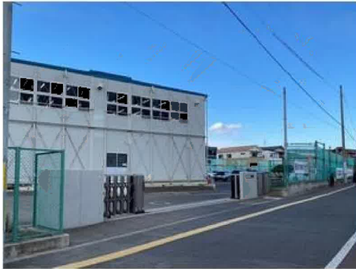
仙台市立長町中学校まで320m