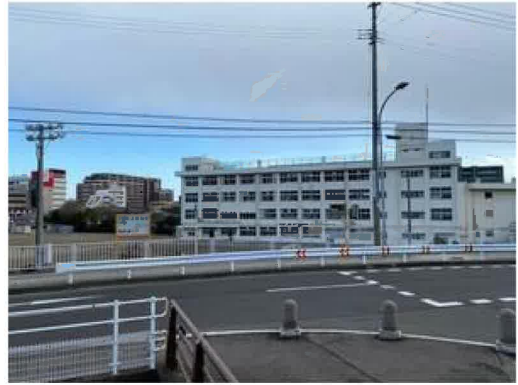
仙台市立鹿野小学校まで180m